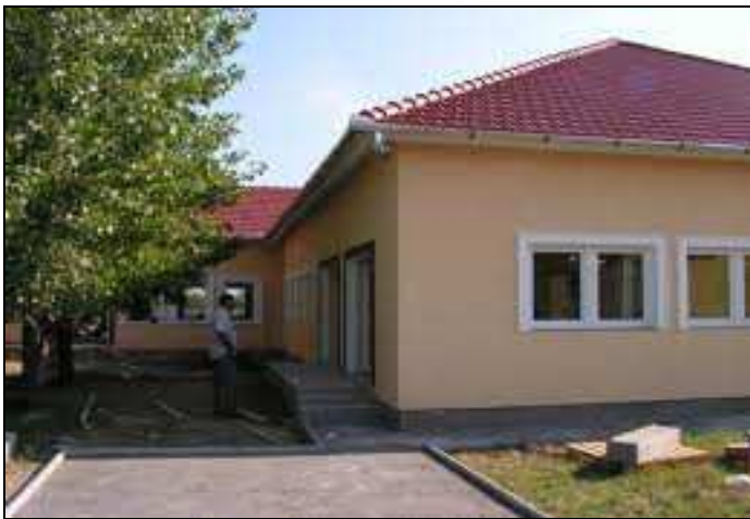
Az új épületszárny

A település életében az elmúlt időszak egyik legnagyobb eseménye az óvoda épületének bővítése volt. A beruházás befejeződött, az új épületszárny átadásra került, amelyben foglalkoztató csoportszoba, fejlesztő és tornaszoba is került kialakításra. A bővítés után a következő évtől lehetőség lesz az úgynevezett ovibölcsi rendszerű nevelésre, melyben további öt fő, két évet betöltött gyermekeket is elláthat az intézmény.